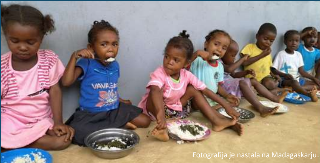
Fotografija je nastala na Madagaskarju.

Največ ljudi, ki trpijo zaradi lakote, živi v Aziji (520 milijonov), sledi Afrika (243 milijonov). V Afriki je lačen vsak peti, v Aziji vsak enajsti posameznik (Afrika ima 1,2 milijarde prebivalcev, Azija ima 4,6 milijarde prebivalcev).