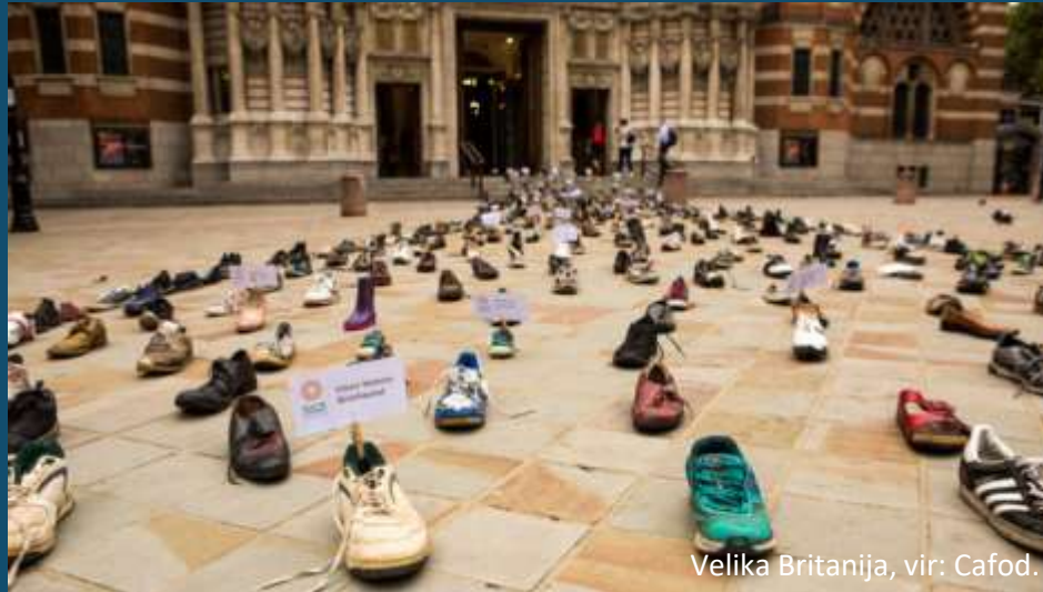
Velika Britanija, vir: Cafod.