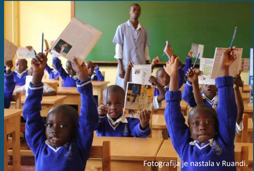
Fotografija je nastala v Ruandi.

Po svetu je okoli 258 milijonom otrokom in mladostnikom onemogočeno izobraževanje, le 49 % najstnikov zaključi srednješolsko izobraževanje.