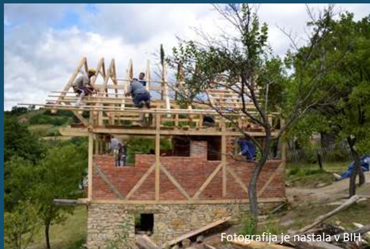
Fotografija je nastala v BiH.

Trajna in vključujoča gospodarska rast lahko spodbudi napredek, ustvari dostojna delovna mesta za vse in izboljša življenjski standard ljudi.