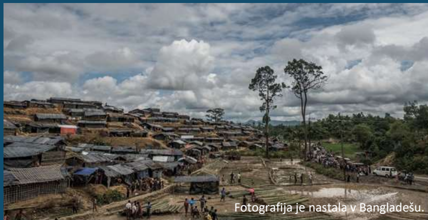
Fotografija je nastala v Bangladešu.

828 milijonov ljudi živi v slumih (barakarskih naseljih), večinoma v Vzhodni in Jugovzhodni Aziji.