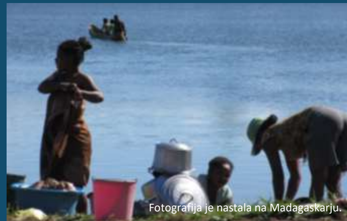
Fotografija je nastala na Madagaskarju.

Kavni lonček poznamo kot izdelek, ki ga je mogoče reciklirati. Ker vsebuje tekočino, je obložen s plastično snovjo, zato se jih reciklira v maloštevilnih posebnih mora objektih. Zgolj 1% kavnih lončkov je recikliranih.