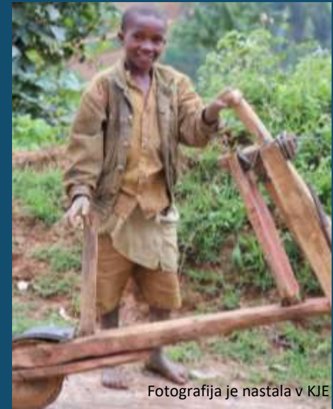
Fotografija je nastala v KJE

Otroci so ena ranljivejših skupin, saj so izpostavljeni nasilju, trgovini z ljudmi, izkoriščanju na migracijski poti, izginotju ali ločitvi od družine.