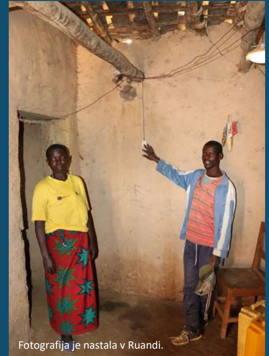
Fotografija je nastala v Ruandi.

Na letni ravni približno 20.000 beguncev umre zaradi ogrevanja ali kuhanja na osnovna trdna goriva.