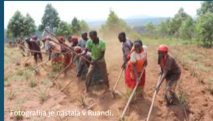
Fotografija je nastala v Ruandi.

Leta 2016 je v Sloveniji pod pragom revščine živelo 280.000 ljudi, približno toliko, kot je prebivalcev v Ljubljani.