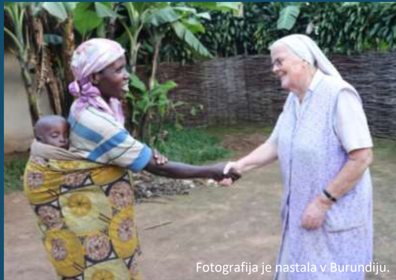
Fotografija je nastala v Burundiju.

Vsak izmed dejavnikov predstavlja zahteve, ki jih bodo morale izpolniti vse države, če želimo uresničiti Agendo 2030.