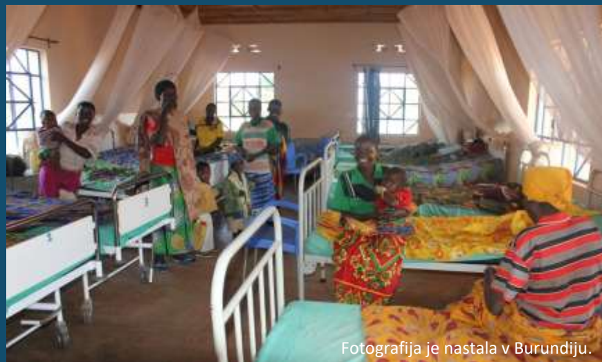
Fotografija je nastala v Burundiju.

Zdravje beguncev in migrantov, ki prihajajo z območij konfliktov ter revščine, je zaradi dolge poti in slabih higienskih pogojev v kampih pogosto načeto. Pogoste so črevesne okužbe, hepatitis A, tifus, virusna prehladna obolenja (tudi bolj ranljiva skupina za okužbo s COVID-19), tuberkuloza in kožne bolezni.