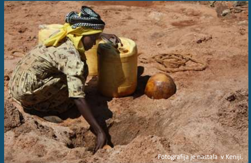
Fotografija je nastala v Keniji.

Do leta 2020 naj bi se zaradi širjenja puščav samo iz Podsaharske Afrike odselilo 60 milijonov ljudi.