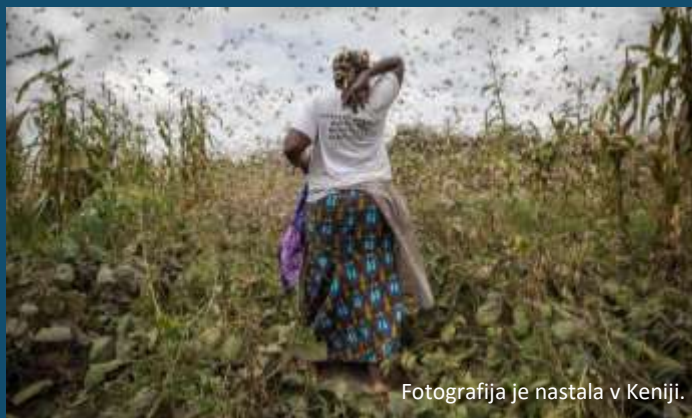
Fotografija je nastala v Keniji.

Če bi vsi živeli kot Slovenci, bi letno porabili za tri planete naravnih virov.