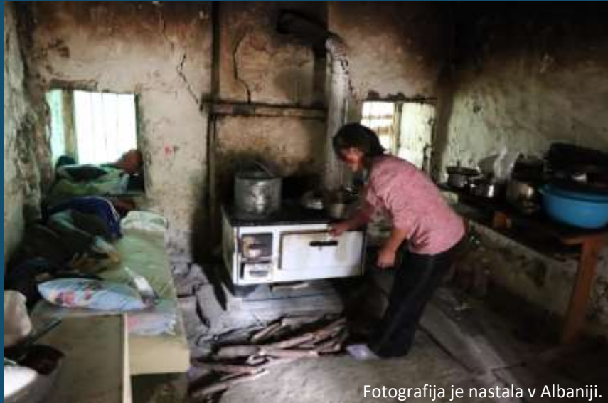
Fotografija je nastala v Albaniji.

62 najbogatejših posameznikov na svetu poseduje enako bogastvo kot 3,6 milijarde najrevnejšega prebivalstva sveta.