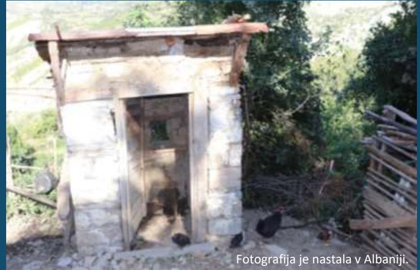
Fotografija je nastala v Albaniji.

6 od 10 ljudi nima urejenih ustreznih sanitarij.