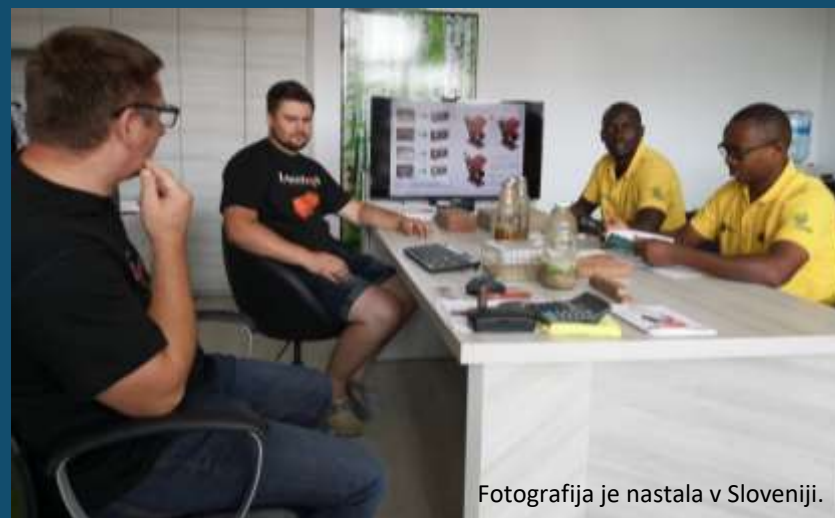
Fotografija je nastala v Sloveniji.

Vključujoča in trajnostna industrializacija lahko, skupaj z inovacijami in infrastrukturo, sprostí dinamične in konkurenčne gospodarske sile, ki ustvarjajo delovna mesta in dohodek.