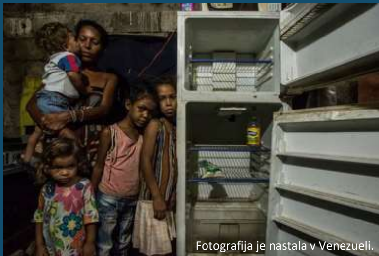
Fotografija je nastala v Venezueli.

V svetu zavržemo 1,3 milijarde ton hrane letno, kar je približno 1/3 vse hrane (večinoma kot posledica neodgovorne potrošnje, izgube v proizvodnji in reguliranja cen hrane na trgu).