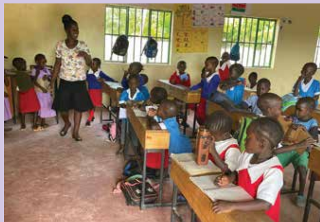
Podpora plačilu dela učiteljev za osnovno šolo v Keniji.