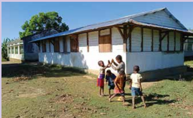
Novozgrajeni učilnici nižje gimnazije v Ampitafo na Madagaskarju.

Vso to pomoč smo zmogli le s pomočjo srčne dobrote Slovencev. Samo beseda HVALA težko zajame vse tisto, kar čutimo skupaj z misijonarji ob tej vaši dobroti. Težko je z besedami opisati, kaj vsa ta slovenska pomoč resnično pomeni revnim in pogosto pozabljenim ljudem na drugem koncu sveta, ki se vas hvaležno spominjajo v svojih molitvah. Naj bo vaša dobrot obilno poplačana v vašem življenju.