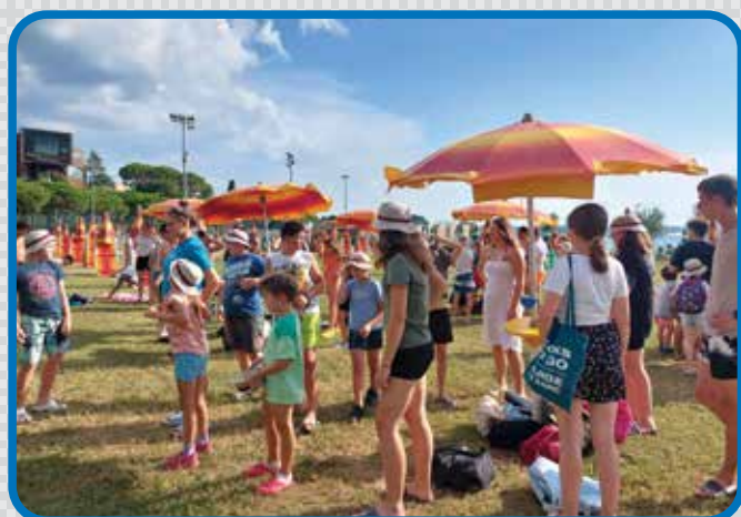
Pripravljene na skok v morje... Biseri 2024 so se začeli in z njimi veliko veselja ob morskih dogodivščinah in spoznavanju Slovenije.