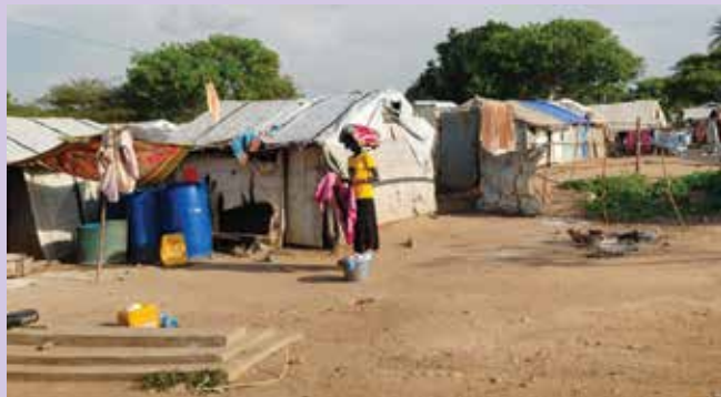
Begunski kamp v Jubi zgrajen na pokopališču, kjer biva več kot 1200 družin

Ko sem prispela v najmlajšo državo na svetu (samostojna od leta 2011) v velikosti za 32 Slovenij sem