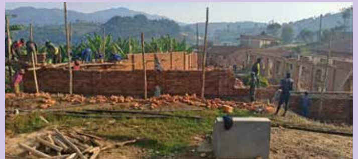
Gradnja internata za dekleta iz oddaljenih krajev v Mukungu v Ruandi.

V Mukungu v Ruandi smo za potrebe srednje šole podprli začetek gradnje internata za 200 revnih deklet iz oddaljenih krajev. Gradnja vključuje spalnice, kopalnice in stranišča. V dela so vključeni domačini.