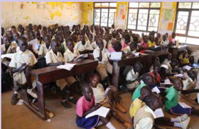
Osnovna šola v Toritu, kjer so dekleta iz projekta prejele vložke in je v vsakem razredu preko 100 mladih

Kot posledica te kompleksne krize je v Južnem Sudanu največji problem lakota, saj več kot 65 % prebivalstva živi v velikem pomanjkanju hrane. Samo stopila sem na ulico, pa sem takoj srečala podhranjenega otroka, kar prepoznaš po barvi las. Joseph, sodelavec Caritas Južni Sudan, mi je povedal, da občutijo hude posledice vojne v Ukrajini, saj ni več uvoza žita in gnojil iz te države in so cene hrane zelo narasle. Večina ljudi je brezposelnih, edina industrija, ki jo imajo, je s