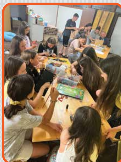
Junija je v Portorožu potekalo letovanje otrok iz Ukrajine in preživelo deset brezskrbnih dni brez groženj vojne.