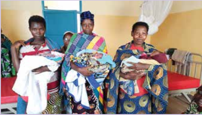
Novorojenčki v novozgrajeni porodnišnici v Kiguhu v Burundiju.

V sklopu zdravstvenega centra v Kiguhu sestre usmiljenke skrbijo tudi za okoli 250 podhranjenih otrok. Lani smo podprli nakup hrane za pomoč tem otrokom. »Burundi je na prvem mestu revščine v svetu. Brez dvoma je s tem povezana tudi kronična podhranjenost, ki se v tem težkem obdobju naše zgodovine le še stopnjuje. To se močno občuti na podeželju in tudi v mestu. Seveda so velike razlike med peščico bogatih in številnimi revnimi, ki komaj zaslužijo za preživetje. Letos je letina zelo slaba: najprej zaradi dolgega deževja in nato zaradi skrajne suše. Politična in ekonomska situacija pa to stanje le povečuje. Že več mesecev nimamo goriva. Zaradi tega s podeželja le s težavo pripeljejo hrano do mesta in tukaj je zelo draga. Sprašujem se, kako družine sploh lahko preživijo, če kilogram fižola, ki je osnovna hrana, stane 1 evro, kar je za burundijske družine ogromno. Zdaj so se začele počitnice; iskreno se bojim, kako bodo naši otroci s posebnimi potrebami, ki jih šolamo v Centru Akamuri, preživeli. O, kako jim bo manjkal Center Akamuri! Zapajmo v Božjo Previdnost! K sreči je kar nekaj družin med najbolj ubogimi v projektu Z delom do dostojnega življenja in bomo tako poskrbele zanje. Ravno danes sem začasno dala delo eni mami in enemu očetu, ki imata invalidne otroke. Tako se ljubezen širi in razdaja. Boglonaj za vse! Bog naj bo vsem dobrotnikom bogat plačnik!« je v teh dneh še zapisala s. Vesna Hiti.