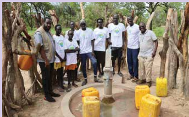
Sodelavci Karitas in domačini ob novi vrtini za vodo v vasi

pitno vodo. Sicer pa imajo na ulicah ob blatnih cestah v večjih krajih male trgovinice ter frizerstva in šiviljstva. Ljudje se trudijo, da bi nekaj zaslužili. Električna je zelo draga in je večkrat zmanjka. Velik problem je tudi šolstvo, saj šola obiskuje le 30 % vseh otrok; družine so številčne in težko je vsem plačati šolnino, tudi mnoge šolske zgradbe so bile uničene. Videla sem šolo kar pod drevesom, s tablo na deblu ... Na podeželju sem spraševala otroke, če hodijo v šolo, pa je bil njihov odgovor večinoma ne, saj je niti nimajo v vasi. Da ne govorimo o zdravstvu: ženske in novorojenčki še vedno umirajo pri porodu, ker nimajo možnosti poroda v bolnišnici, malarija pa je ubijalec številka ena, še posebej pri otrocih.