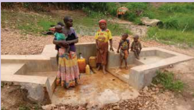
Novozgrajeni vodnjak v Gitegi Burundi.

V Gitegi v Burundiju smo omogočili gradnjo 12 vodnjakov v vaseh in dostop do čiste vode 907 revnim družinam ter obnovili dve hiši za revne skupaj s s. Bogdano Kavčič, ki je ob tem zapisala: »Pred nekaj tedni sem se vrnila iz Slovenije, kjer sem srečala veliko dobrih ljudi, ki nam prihajajo na pomoč v naših