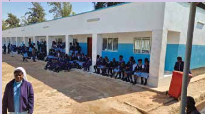
Šest novozgrajenih in opremljenih učilnic gimnazije v Lusaki v Zambiji.