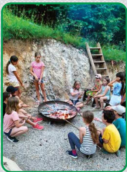
Dve skupini otrok sta na Rakitni 'kuhali skupaj' in spoznavali zdravo prehrano in žita.