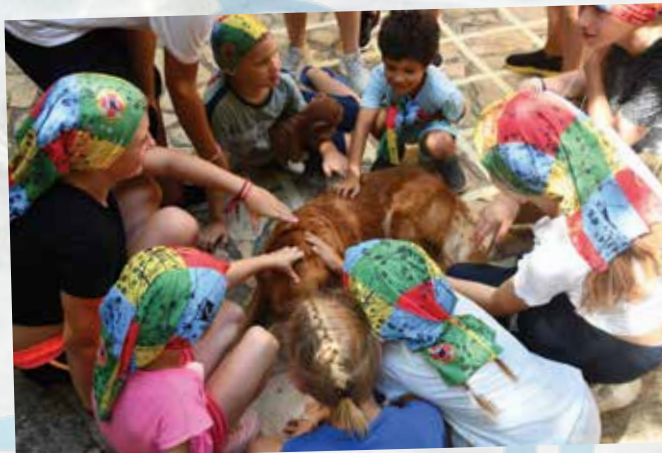
Med zanimivimi gosti so bili tudi Jamarska reševalna služba' s svojimi reševalnimi psi.