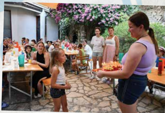
Skupaj smo praznovali tudi rojstne dneve s posebnimi tortami.