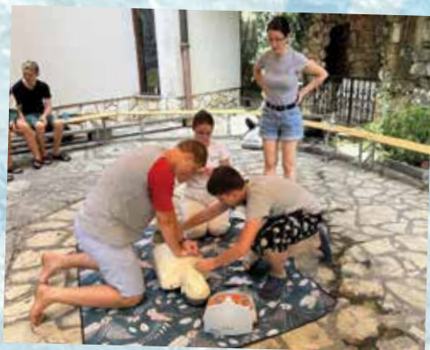
Tudi učili smo se za življenje.