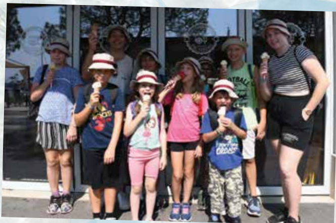
Kako dober je sladoled v Portorožu!