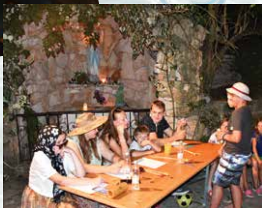
Ni lahko zmagati na tekmovanju iz talentov pri tako strogi komisiji.