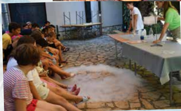
In ko so nas obiskali predstavniki 'Šole eksperimentalne kemije Inštituta Jožefa Stefana', so se začele dogajati čudne stvari.