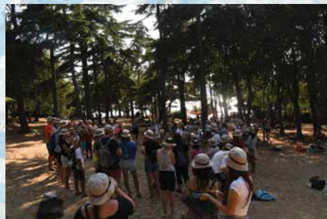
Na plaži v Izoli so v vročih dneh našli tudi prijetno senco.