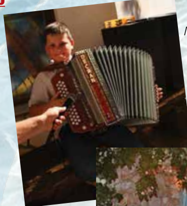
Med udeleženci smo odkrili veliko talentov, ki so se pomerili na tekmovanju 'Biser ima talent' plaži.