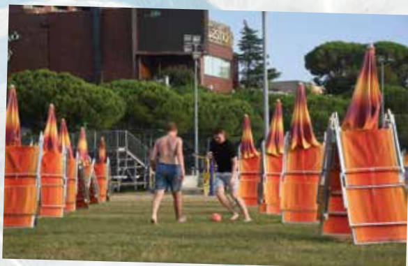
Nogomet smo igrali med senčniki in ležalniki na portoroški plaži.