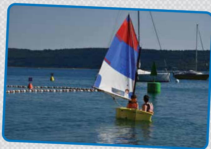
Velika in mala ladja, obe nas peljeta po morju. Na obeh zanimiva izkušnja. Otroci in animatorji so na Počitnicah biserov doživeli veliko morskih dogodivščin.