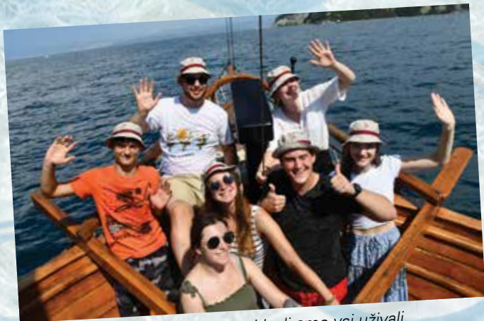
Na vožnji z ladjo proti Izoli smo vsi uživali.

Pa preko fotografij podoživimo letošnji utrip.