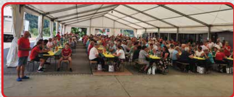
Sodelavci in prostovoljci Karitas mariborske nadškofije so se že dvanajstič podali na romarsko pot. Tokrat v Marijino svetišče v Puščavi in k sv. Lovrencu na Pohorje.