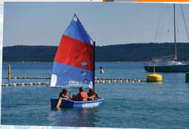
Celo jadrali smo v piratovi šoli jadranja.