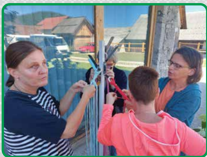
Na taboru slepih in slabovidnih Slovenije, ki je potekal v vasi Podcerkev pri Starem trgu pri Ložu, so spoznali veliko novih stvari in podarjenih jim je bilo obilo skupnih doživetij.