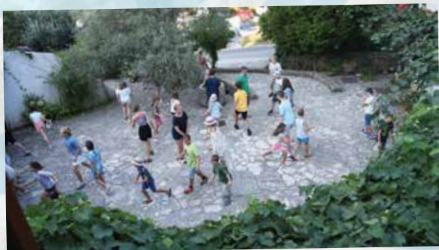
Jutranja telovadba je bila na dvorišču pred župniščem.