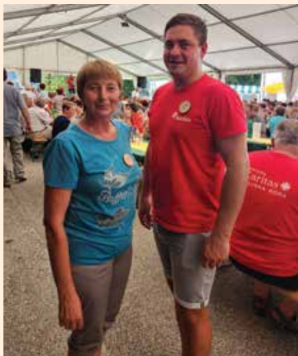
V pogovoru z youngCaritas