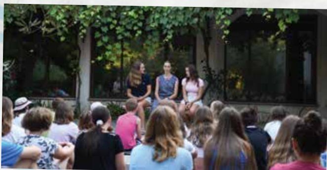
Vsako jutri smo v igrici skupaj z babico in vnučko spoznavali kraje po Sloveniji in se tako seznanjali s pokrajinami in lepoto Slovenije.